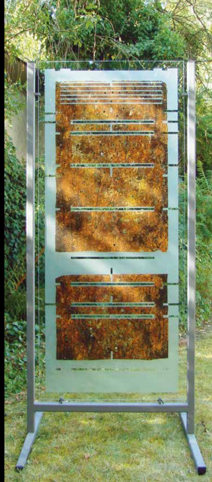
- Die Stelen sind für Ausstellungen anzufragen und käuflich zu erwerben -

nicht glatt, sondern rau, rissig und brüchig. Die Malerei gewinnt substanzuelle Expressivität aus der Materialität der Farbe und wird so zum bildnerischen Drama.