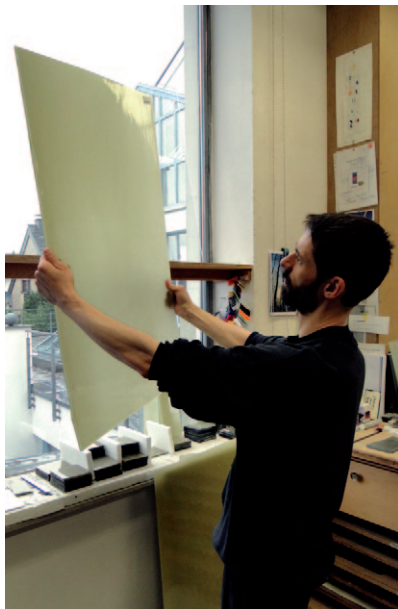
Aussuchen der Gläser

Mit ihnen - der flächengrößten Glasgestaltung der Dessauer Bauhausperiode an sich - gab man im Museum an zentraler Stelle dem Bekenntnis zur künstlerischen Avantgarde überzeugend Raum. Im zweiten Weltkrieg durch Bomben zerstört, mussten die Albers-Fenster lange als verloren gelten.